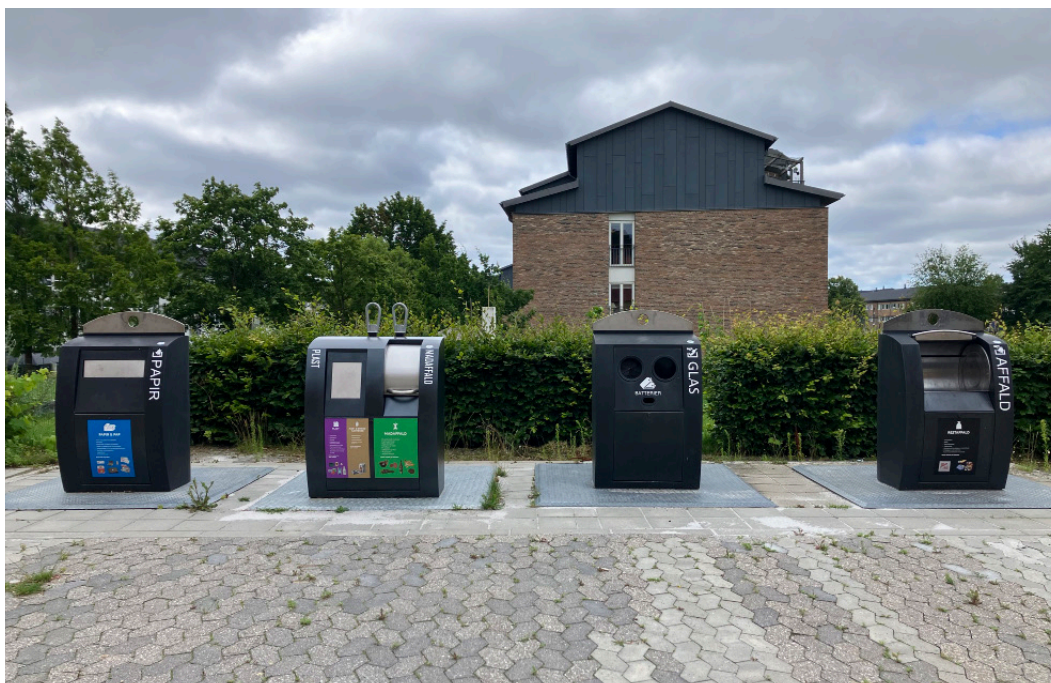
Bag Laden er opstillet en række molokker til hhv. papir, plast, madaffald, glas og restaffald.

Vær opmærksom på, at større affaldsposer med køkkenaffald kun fyldes halvt op, ellers risikerer de at sætte sig fast i molokkens lukkemekanisme.