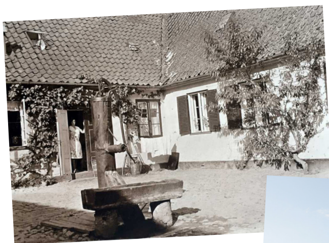
Billedet af den gamle gårdsplads med hestetrug er lånt fra Helsingør Museers Arkiv.

Som udgangspunkt vil Gl. Vapnagaards lokaler ikke kunne benyttes til rent kommercielle arrangementer.