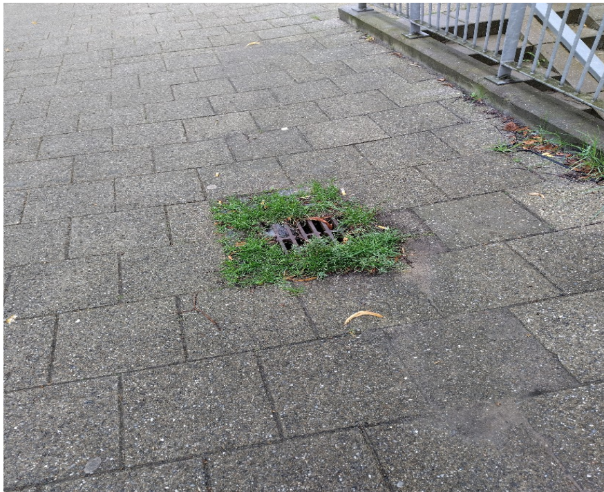
Dette er pænt

Driften har planlagt, at regnvandsafledningen skal checkes og brønde renses. Og så vil det selvfølgelig nok hjælpe, at ristene holdes fri fra bevoksning..... Vi glæder os til projektet er gennemført.