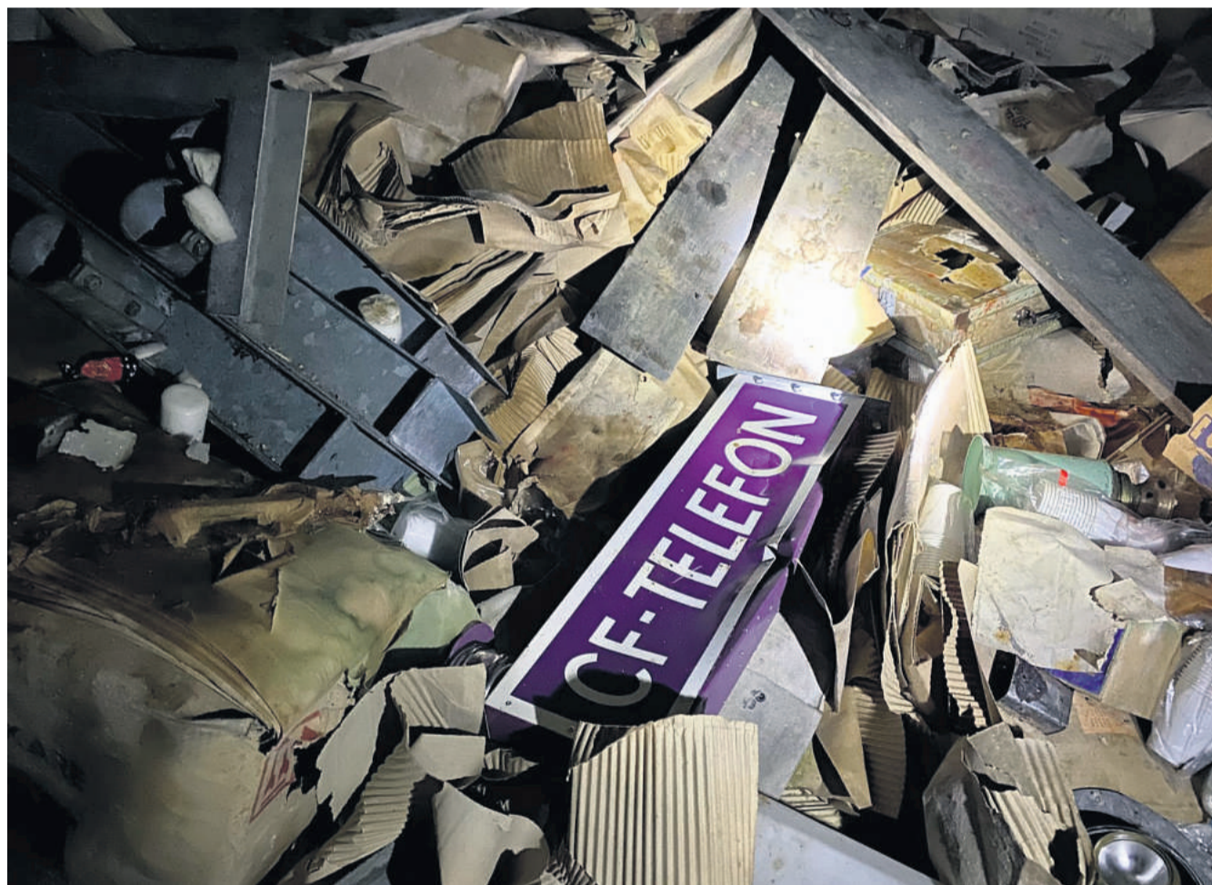
Beskyttelsesrummet på Rosenkildevej.

moderniseret i 1991. Men allerede i 2003 blev den nedlagt.