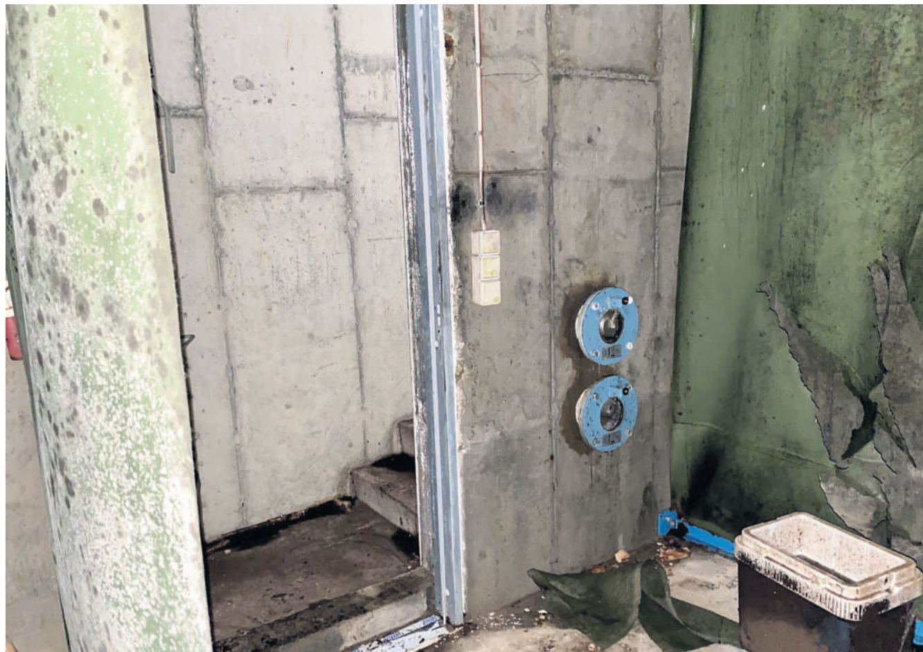
Beskyttelsesrummet på Rosenkildevej.

Det største beskyttelsesrum i kommunen finder du midt på Rosenkildevej, dertil kommer kommandocentralen på Århusvej, der stod ny-