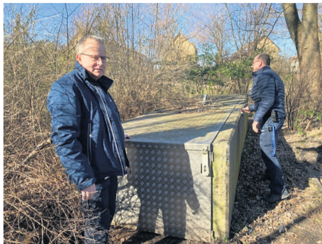
Beskyttelsesrummet på Rosenkildevej.