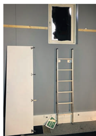
Nøddudgangen i sikringsrummet under servicecenteret på Vapnagård fører ud i en skakt, som bliver tilset og rengjort fire gange om året.

I nybyggeri er der intet krav om sikringsrum mere, men loven om sikringsrum gælder for så vidt stadig, så mange boligforeninger, offentlige bygninger og store virksomheder har sikringsrum. I 2003 blev klargøringsfristen på 24 til 48 timer sløjft fra lovgivningen. Nu har indenrigs- og sundhedsministeren hjemmel til at fastsætte en klargøringsfrist efter en konkret vurdering i en given situation.