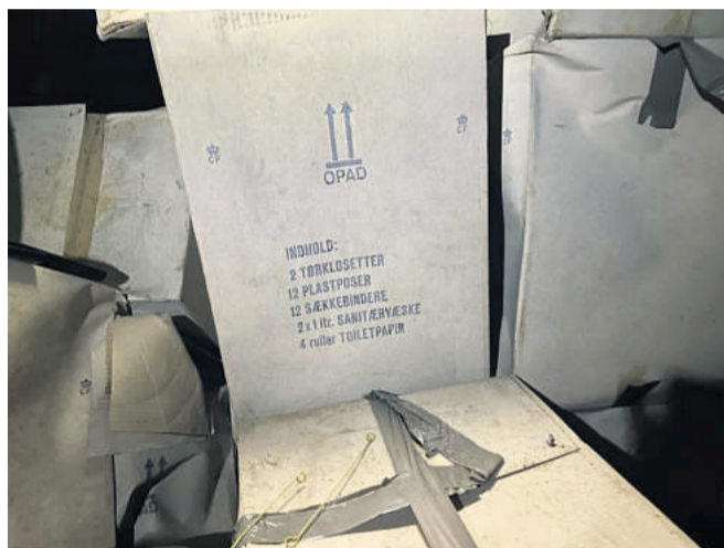
Beskyttelsesrummet på Rosenkildevej.