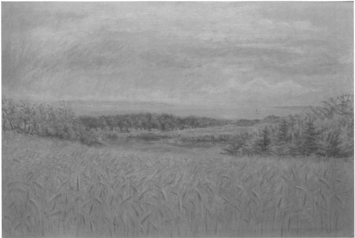
Udsigten fra Vapnagaard. Maleri af Knud Agger, 1942. Privateje.

der ikke varme i togene, så min far og de andre daglige benytttere af banen (det hed ikke "pendlere" dengang) havde foruden mappen med morgenavisen og forretningspapirerne også tæpper og sivsko med til at holde kulden på afstand. Tydeligt mærkede vi, at Danmark var besat land, når vi om aftenen gik op på "Hestens Bakke" og kiggede over mod Sverige. Der strålede lysene, mens der ikke var et eneste lys at se i det besatte, mørklagte Danmark.