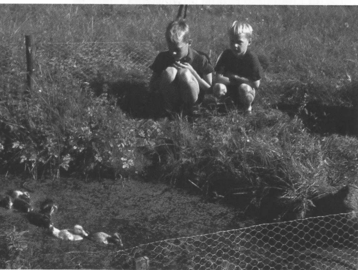
Ællinger ved dammen i bunden af haven ved Vapnagaard.

Ved siden af markvejen fra Kongevejen lå der en stor gammel, faldefærdig lade. Her kunne vi