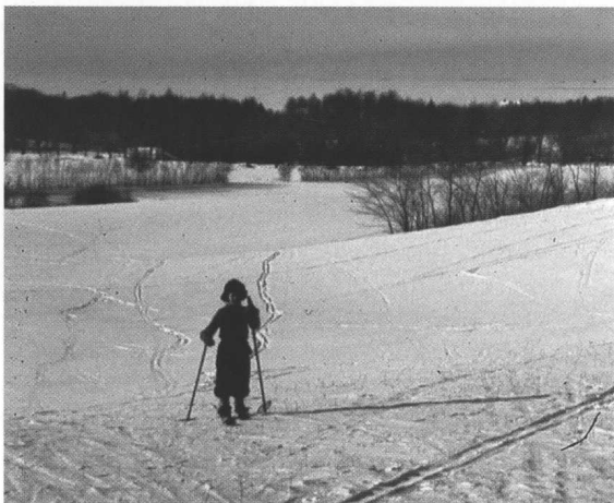
Skiløb ved Hestens Bakke i vinteren 1942.

I vintertiden kunne man godt føle sig isoleret på gården. Markvejen ud til Kongevejen sneede til og var lang og besværlig at rydde. Det hjalp dog ikke, at min bror og jeg beklagede os over besværet, for vi skulle i skole hver dag. Selvfølgelig på cykel. Andre muligheder var der ikke, medmindre man ville bevæge sig til fods, og det gad vi ikke; der var alt for langt at gå helt ned til skolen på Marienlyst Allé. Vintrene i begyndelsen af 1940'erne var meget strenge, med lange perioder af frost, så at selv den lille sø for enden af haven var bundfrossen, men kun en eneste gang husker jeg, at vi fik lov til at blive hjemme på grund af vejret. Det var en morgen, hvor der i nattens løb havde dannet sig isslag - alt var dækket af et tykt lag is. Det var helt umuligt at cykle, og selv at trække cyklerne ud til Kongevejen var håbløst. Efter lange