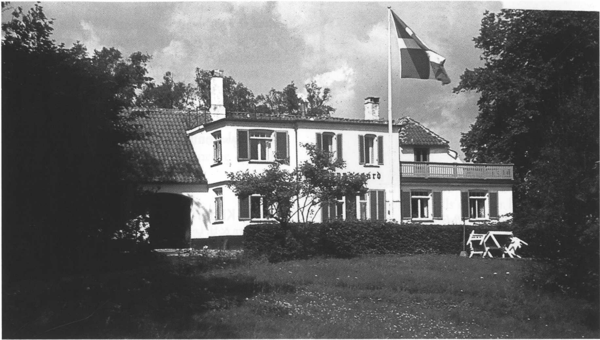
Facaden på hovedbygningen på Vapnagaard, sommerdag ca. 1941 Bemærk porten til venstre. Den blev senere sløffet.