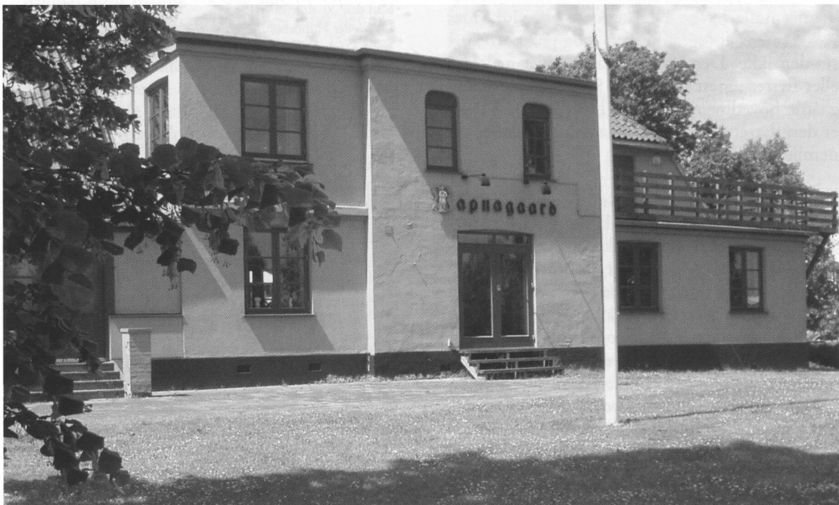
Den stadig eksisterende hovedbygning idag.