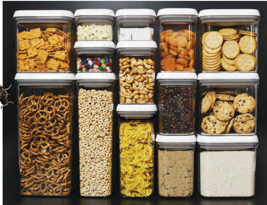
Orden og lufttætte plastbøtter sparer både penge og hjælper med at holde kryb ude af dine madvarer

Det er også vigtigt, at man med det samme får smidt affald fra husholdningen væk - ned i skraldespanden, og så snart