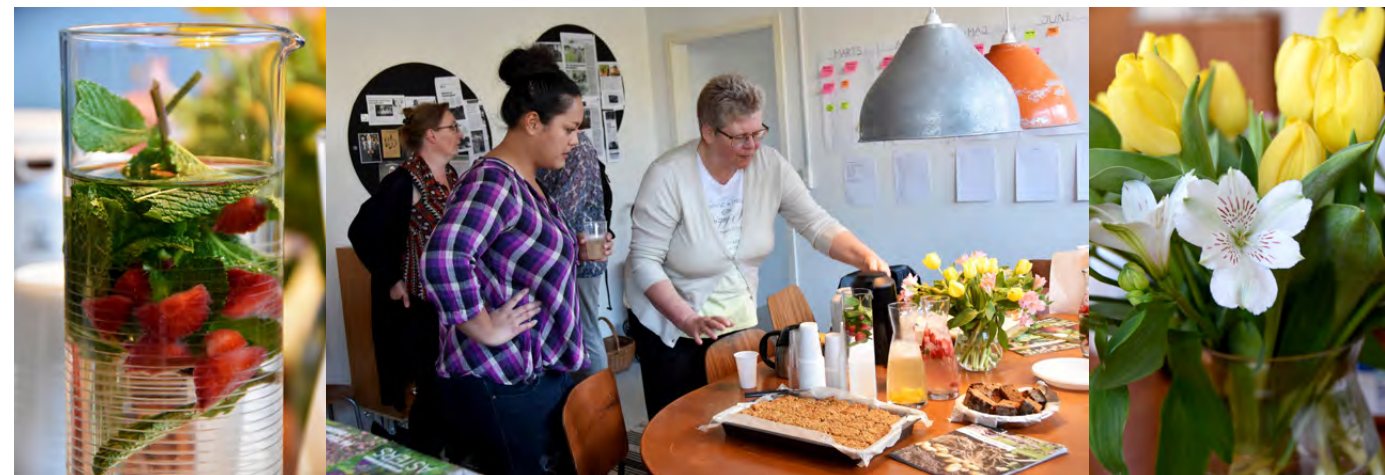
Jordbærdrik, kage og blomster var på bordet, da Haveforeningen TrelHest for nylig indviede nye lokaler.