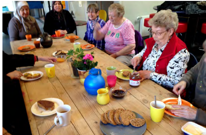
Medlemmer af seniorklubben Det Grå Guld var på udflugt i Vapnagaards nærområde - Multiparken, CUBE og Villa Fem for at høre mere om aktiviteterne der.

- Den tur har givet os et godt indblik i et område, der ligger tæt på Vapnagaard, så vi var meget begejstrede allesammen, og vejret var med os, så vi kunne sidde i solen, griner Anette Krone, da Vapnagaard Nyt fanger hende i