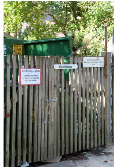
De 11 områders containergårde er til storskrald og have-affald.