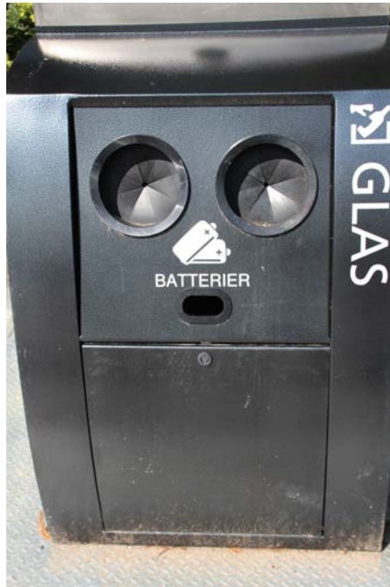
Rundt på Vapnagaard er der opstillet nye affaldscontainere til papir, flasker og brugte batterier.