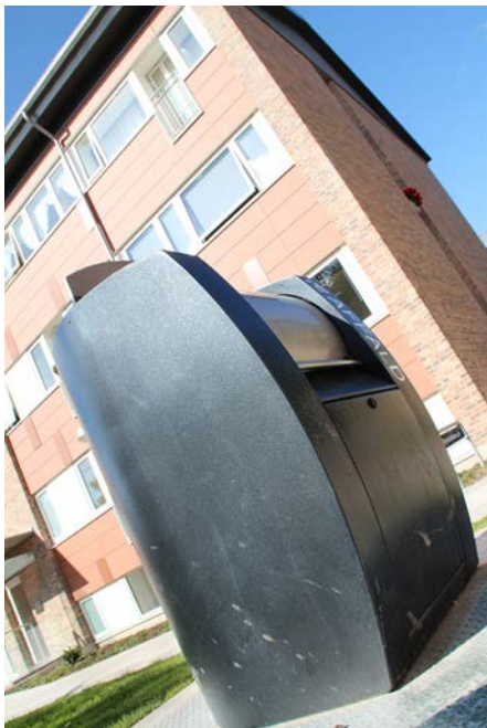
De nye nedgravede molokker er kun til dagrenovation.