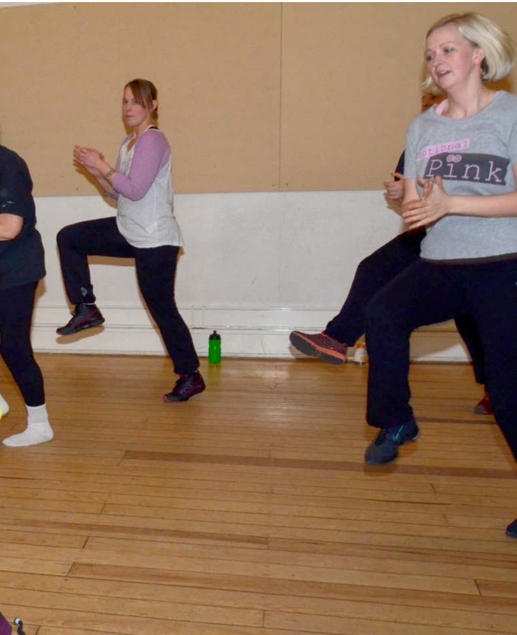
mambo indgår i zumba.