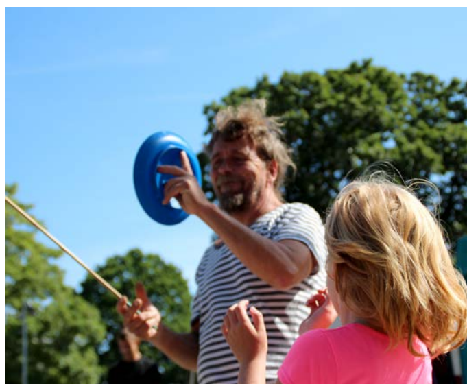
Børn og barnlige sjæle fik mange timers morskab ud af de glade gøglere fra Cirkus Panik. (Foto: Mikkel Frank).