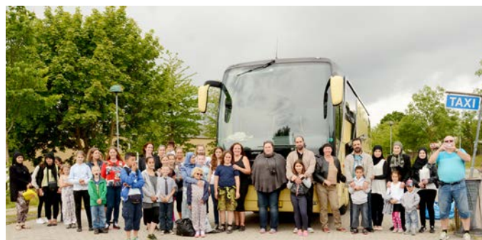
Hele sommerholdet samlet kort før afrejse.