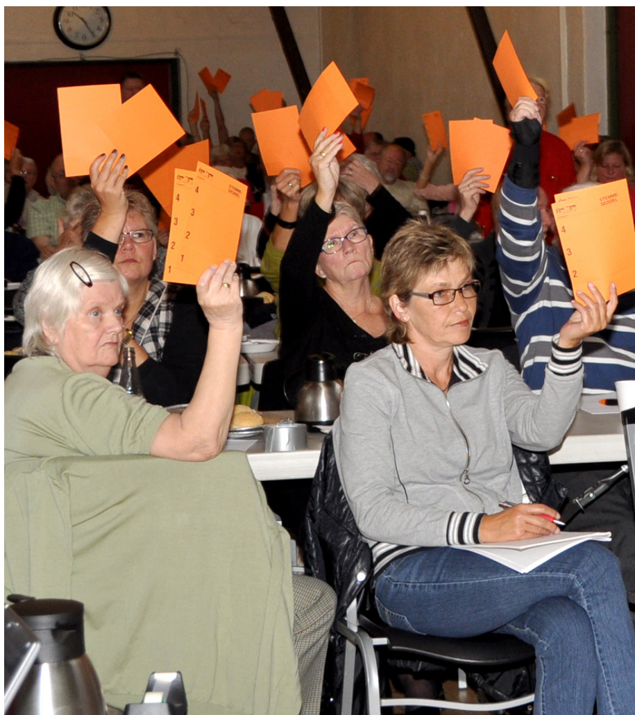
Fællesmødet på Vapnagaard afholdes i år den 14. september i Laden på Gl. Vapnagaard.