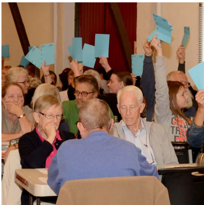
Fællesmøde søndag den 13. september.