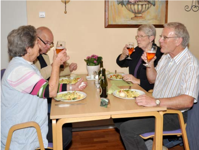
Væbnercaféen genåbner med manér.