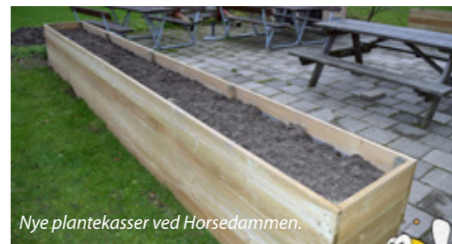
Nye plantekasser ved Horsedammen.