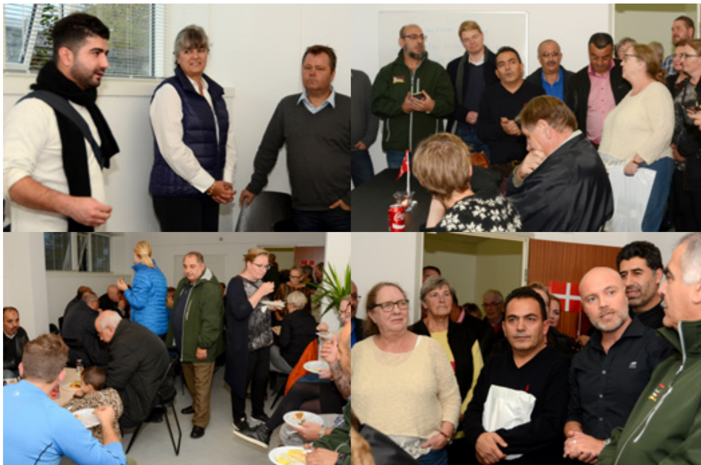
Der var stuvende fyldt, da Vapnagaards Fædregruppe i efteråret holdt reception for at markere, at gruppen har været aktiv i et års tid nu. Lokalpolitikere, beboerdemokrater fra Vapnagaard og andre interesserede var mødt op for at vise deres støtte.