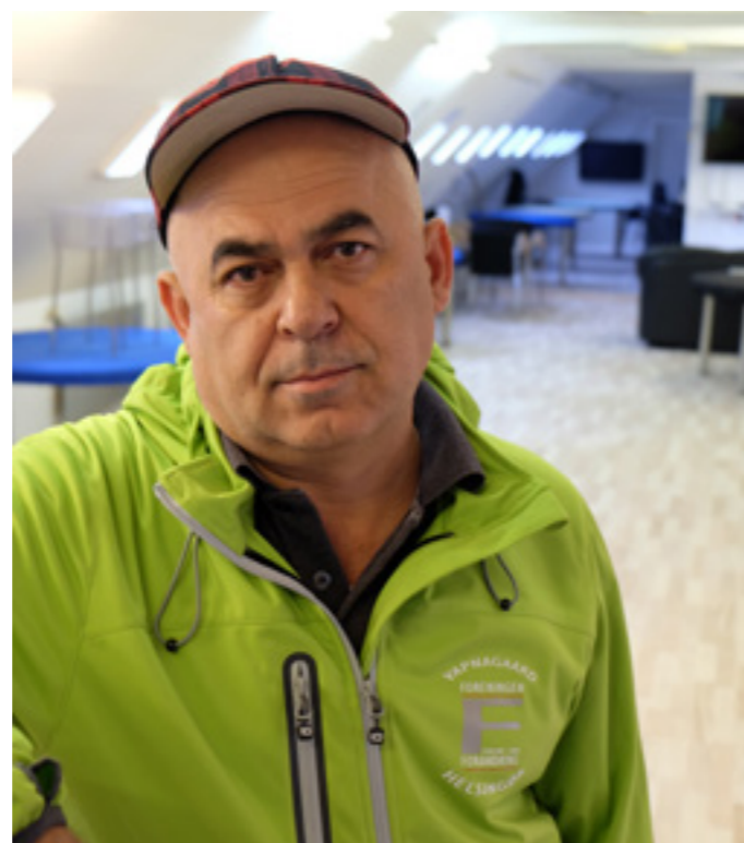
Mellem jul og nytår holder Den Tyrkiske Kulturcafé (Hovmarken 8) åbent, så du er velkommen til at kigge forbi, få en sludder og en kop kaffe til at skylle højtidsdagene ned med. Det oplyser Kudret Acikel fra kulturcaféen.