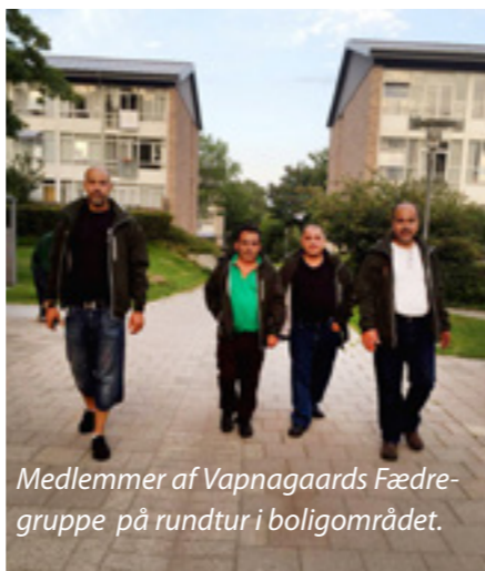
Medlemmer af Vapnagaards Fædregruppe på rundtur i boligområdet.