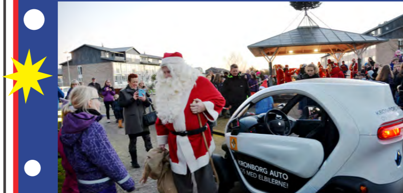
Så blev det atter jul på Vapnagaard! Julemanden kom i år i en 'elektrofice-ret kane' venligst udlånt af Kronborg Auto i Helsingør.