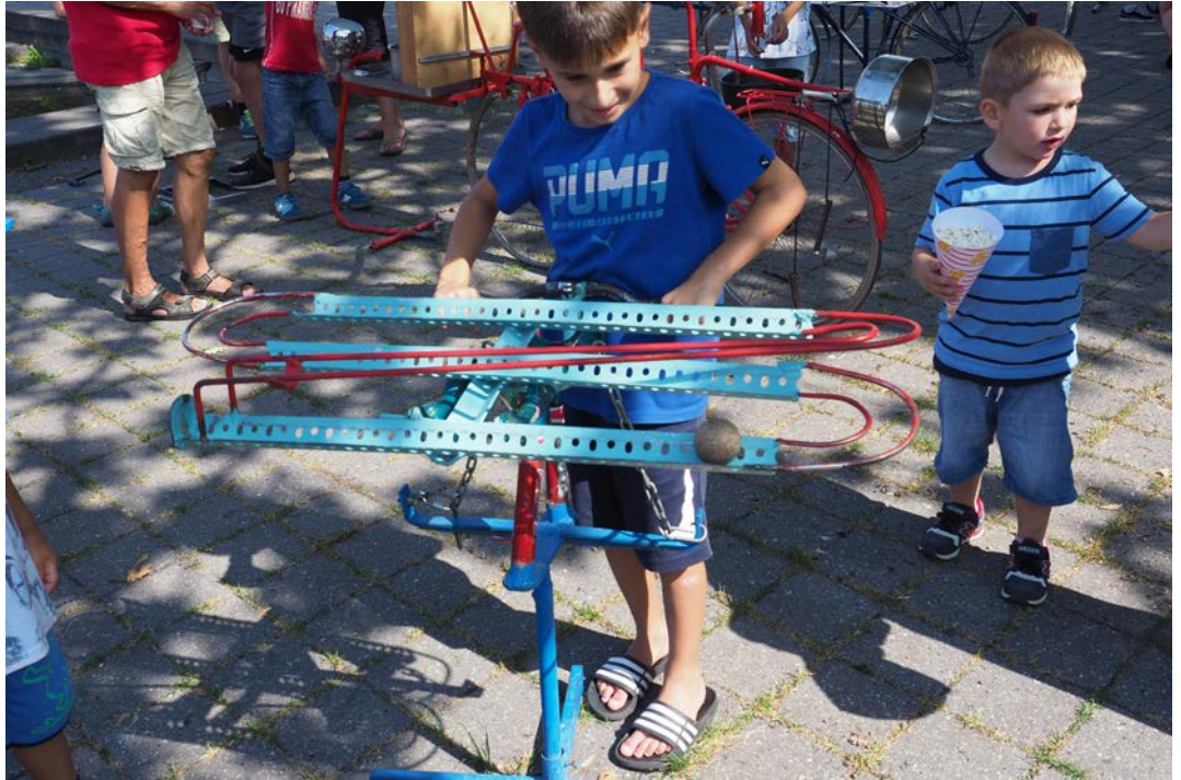
En legeplads af gamle cykler