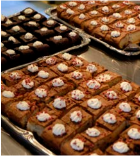
Der var masser af kage...