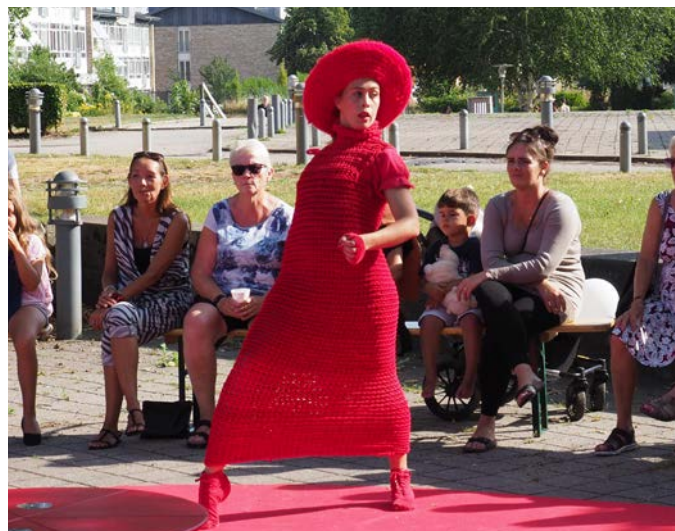
Spansk Rød - og masser af udstråling