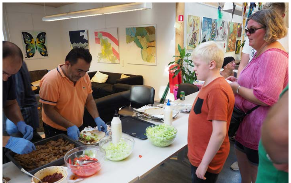
Vapnagaard Fædregruppe stod for maden - rullekebab