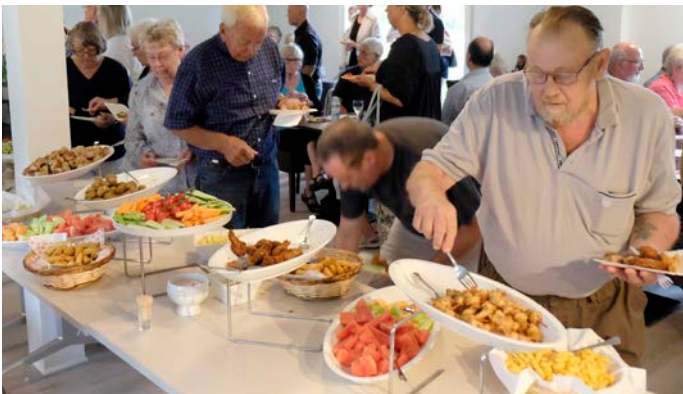
En velspækket buffet, hvor Vapnagaard Nyts udsendte må indrømme, at han var tre gange ombord i forårsrullerne - uhm