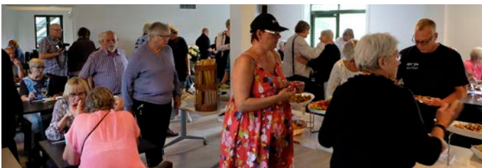
En god blanding af beboere, ansatte, familie og venner lagde vejen forbi caféen

Torsdag og fredag er der åbent frem til klokken 20, og her kan man udover at tage mad med hjem også spise i den nyindrettede café.