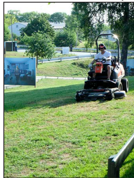
Claus fra gartner-teamet i aktion.