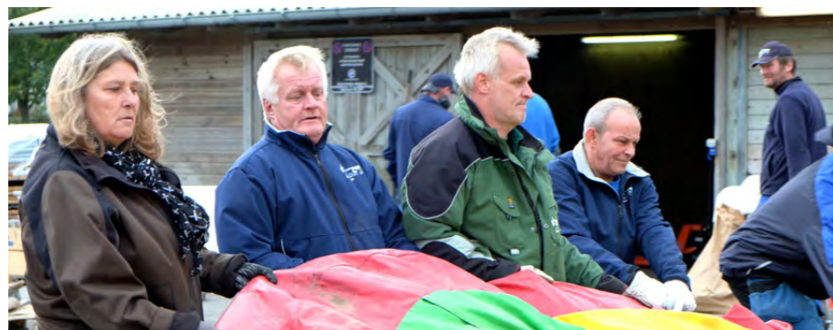
De blå og grønne mænd trækker på samme hammel.

Tekst: Mikkel Frank