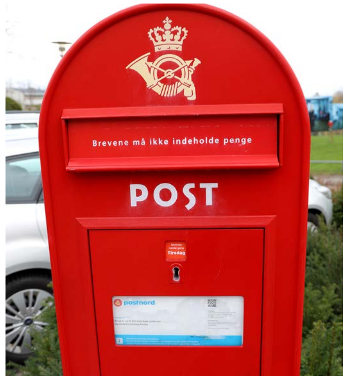
Den 19. april i år er det slut med papirbreve fra Boliggården.

Vapnagaard Nyt Januar 2019 49. årgang · Nr. 1