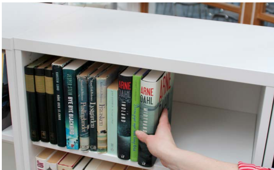
Bøgernes put-and-take - et beboerbibliotek

Ligger du inden med bøger, du selv er færdig med, så kan du komme op i Vapnagaard Servicecenter, Hovmarken 7 og sætte dem op i reolerne, så kan andre få glæde af dem. I øjeblikket er der flest bøger på dansk, men der er også enkelte på engelsk, tysk