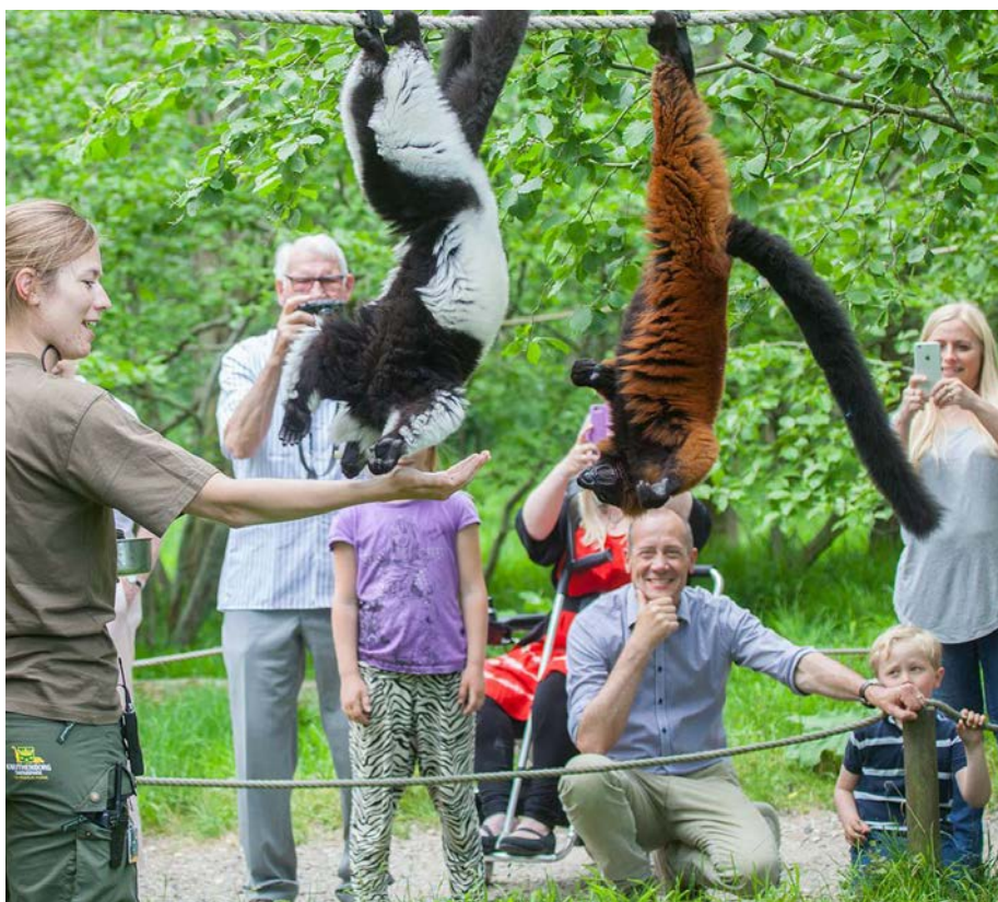
Med på programmet til årets fællesferie er en tur til Knuthenborg Safari-park.

Fælles sommerrejse 2019. 29. juni til den 4. juli. Ansøgningsfrist: Mandag den 8. april. Ansøgningsskemaer hentes hos Kirsten Nørregaard i Vapnagaard Servicecenter (Hovmarken 7).