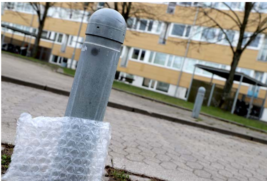
Plast og andet affald skal snappes væk fra Vapnagaard - kom og giv en hånd med den 31. marts.

Kontakt eventuelt Sarah Staal for mere information på 3036 7492.