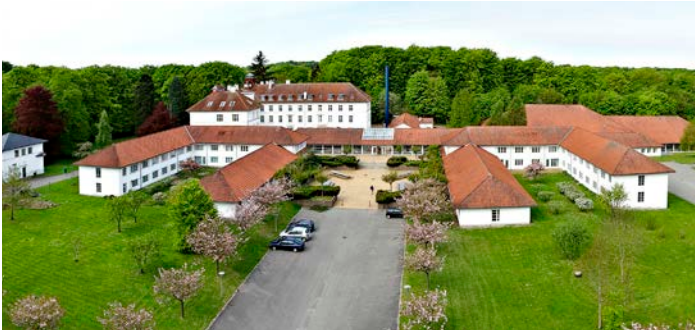
Højskoleopholdet finder sted i disse smukke rammer ved Præstø på Sydsjælland.