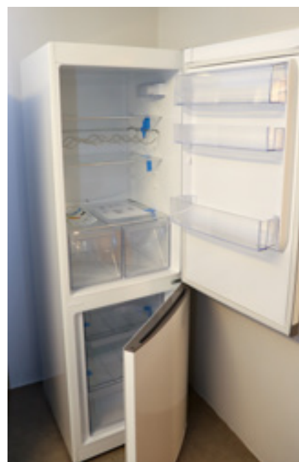
Standard-Electrolux køleskabet er uden udvendige håndtag og med en mindre bue, så der er bedre plads i nichen i køkkenet.

Aftalen om de nye køleskabe forventes at falde på plads i slutningen af februar, herefter udsendes det lovpåkligtede seks-ugers varsel til beboerne inden udskiftningen kan starte i april.