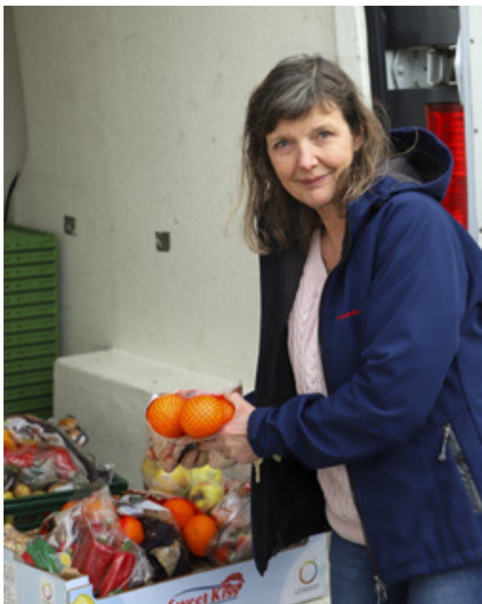
I fødevarekasserne finder man typisk masser af frugt og grønt, men også brød, mælk, kød og pålæg.