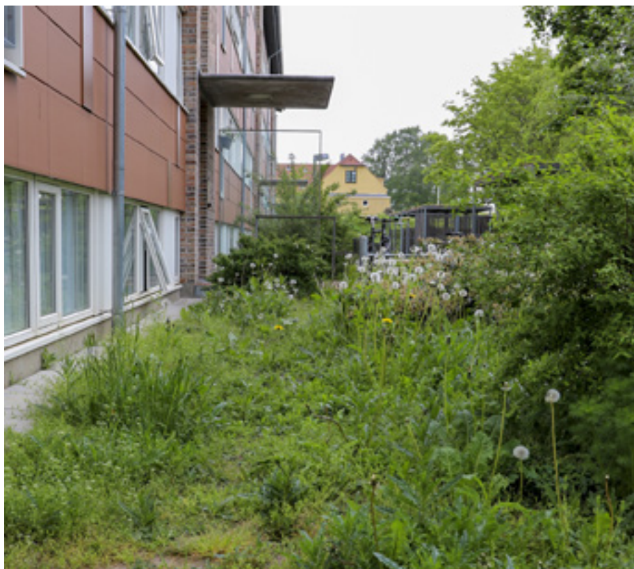
Der er udsigt til en ende på mælkebøtte og tidsel-vældet.

De steder, hvor man kan se, at de eksisterende bundplanter trives bibeholdes disse selvfølgelig, i andre bede plantes der græs, og endelig er en løsning med flis bedste mulighed for en del bede - dette gælder især nord-vendte bede i Hestens Bakke Vest og Sporegangen, men der kan også være andre blokbede, hvor dette er eneste mulighed.