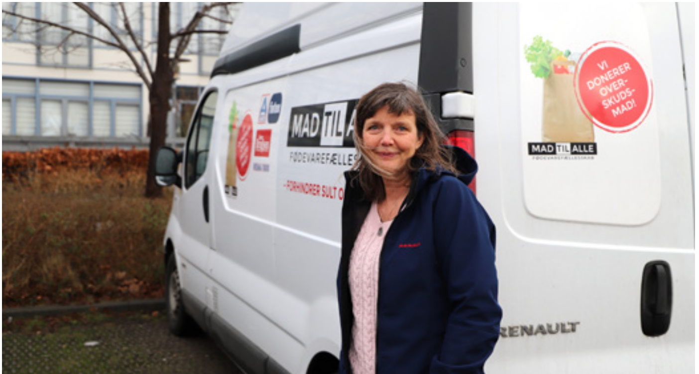
Maden køres fra det smiley-godkendte køkken i Gilleleje til Helsingør i en kølevogn to gange om ugen.