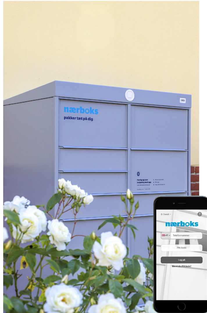
En af tre nye pakkebokse på Vapnagaard, her ved Kulturhus Syd i Hovmarken.

Nordic Infrastructure er samarbejde mellem det danske firma SwipBox og PostNord. Nærboksen er dansk udviklet og produceres hos SwipBox i Sønderborg. Nærboks har i øjeblikket en omsætning på cirka 10.000 pakker om måneden. Boksene er batteridrevne og er således ikke tilsluttet el-nettet på Vapnagaard