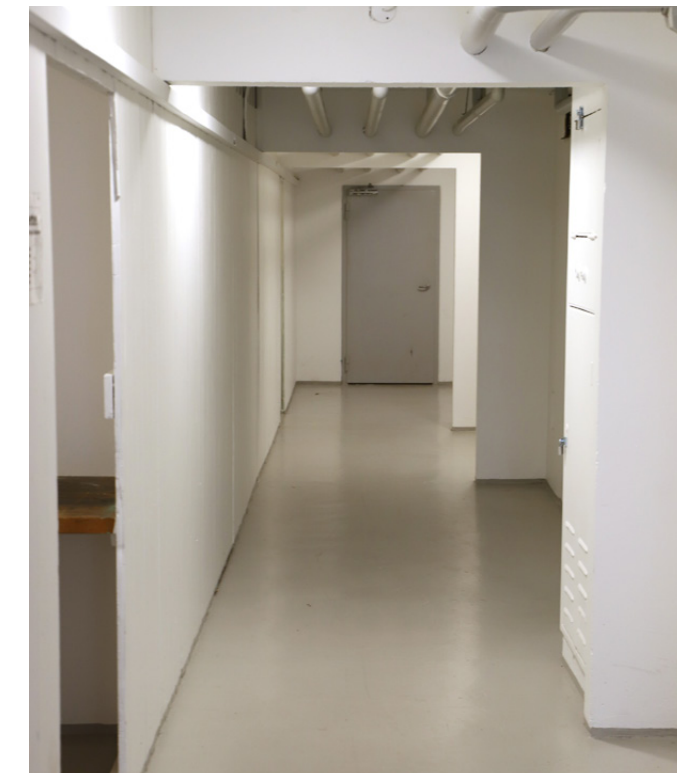
To kældre i samme område, Sporegangen. Forskellen er til at få øje på, mener ejendomsfunktionær Allan Pedersen, der er i gang med at støvsuge.