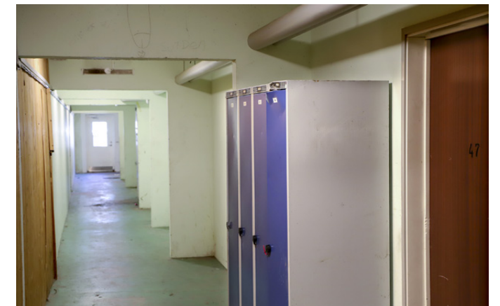
Gamle omklædningskabe smidt i kælderen i Hesteskoen.